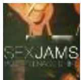
Sex Jams Post Teenage Shine Siluh Records

Die erste Irritation stellt sich beim Bandnamen ein, der Assoziationen an eine Funkband der 80er Jahre auslöst. Diese werden beim Reinhören in den ersten Track „Happy Birthday J.D.“ abgelöst durch den Verdacht, es handle sich um einen Hidden Track auf Sonic Youth Noiserock-Meilenstein „Daydream Nation“. Ist er aber nicht und - nein - es handelt sich auch um keines der vielen sideprojects der New Yorker Band.