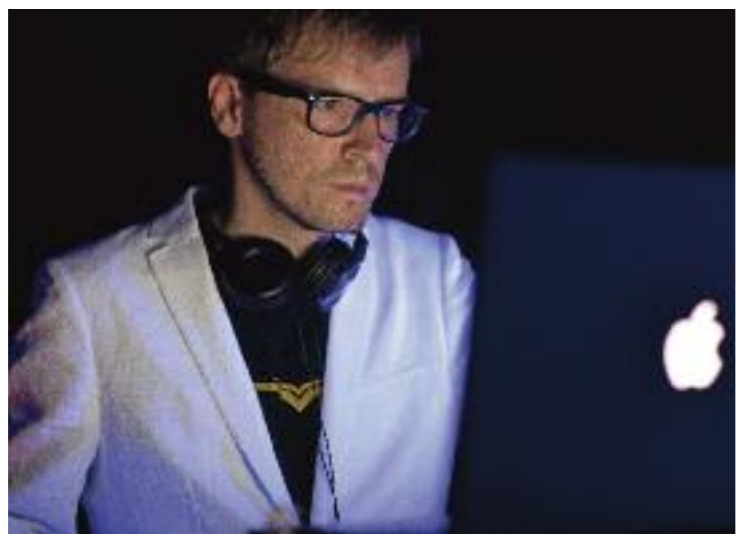
DJ WLF mit einem seiner „Instrumente“

C-F: Vielen Dank für das Interview. www.myspace.com/60245960 (das ungekürzte Interview findet ihr auf www.city-flyer.at )