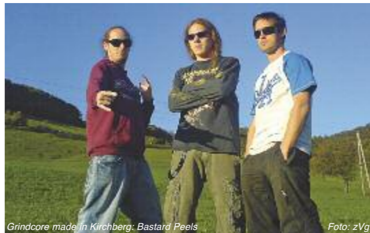
Grindcore made in Kirchberg: Bastard Peels