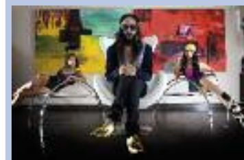
Steve Aoki