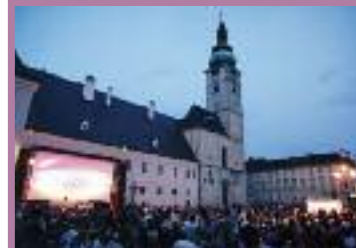
Film am Dom

Der Verein „Cinema Paradiso“ veranstaltet auch heuer wieder das „Film am Dom“-Festival, das diesmal von 24. bis 27. Juni statt finden wird. Zu sehen gibt es die Filme „Willkommen bei den Sch'tis“, „Der Knochenmann“, „Contact High“ und „Slumdog Millionär“. Im Vor-