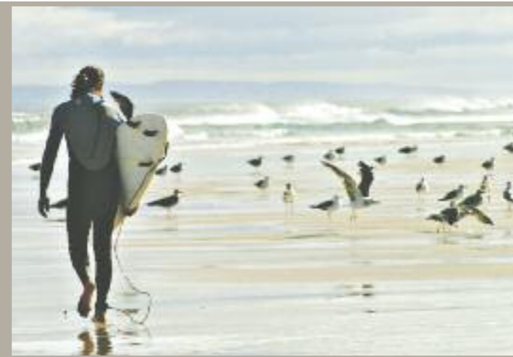
Einer der Mellowmove-Gäste bei seiner liebsten Beschäftigung

Wie sucht ein österreichischer Binnenlandbewohner etwas, das er hier nicht finden kann? Richtig, er geht auf Reisen. Mit dem richtigen Vibe im Gepäck erzählen zwei „Mellowmove“-Akteure über das Reisen, das Suchen und das Finden einer Welt, die mit der unsrigen wenig gemein hat.