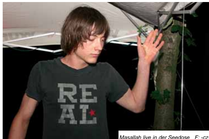
Masallah live in der Seedose F: -cz-

Cinema Paradiso nach Berlin) in der „Seedose“ am Viehofener See Premiere. Die Liebe zur elektronischen Musik war schon lange da und das Interesse daran selbst welche zu machen, wurde durch das Experimentieren am Computer entfacht. Die Stilsuche von Masallah zog sich über mehrere Jahre, zu Beginn versuchte er sich zum Beispiel am Dub. Der Richtungswechsel zum Techno kam erst im Laufe des letzten Jahres. Inspiriert wird er durch das St. Pöltner Nachtleben. Wer tanzen will, ist mit Masallahs Tracks gut bedient. Einige Hörproben finden sich im fm4 Soundpark. -sw-