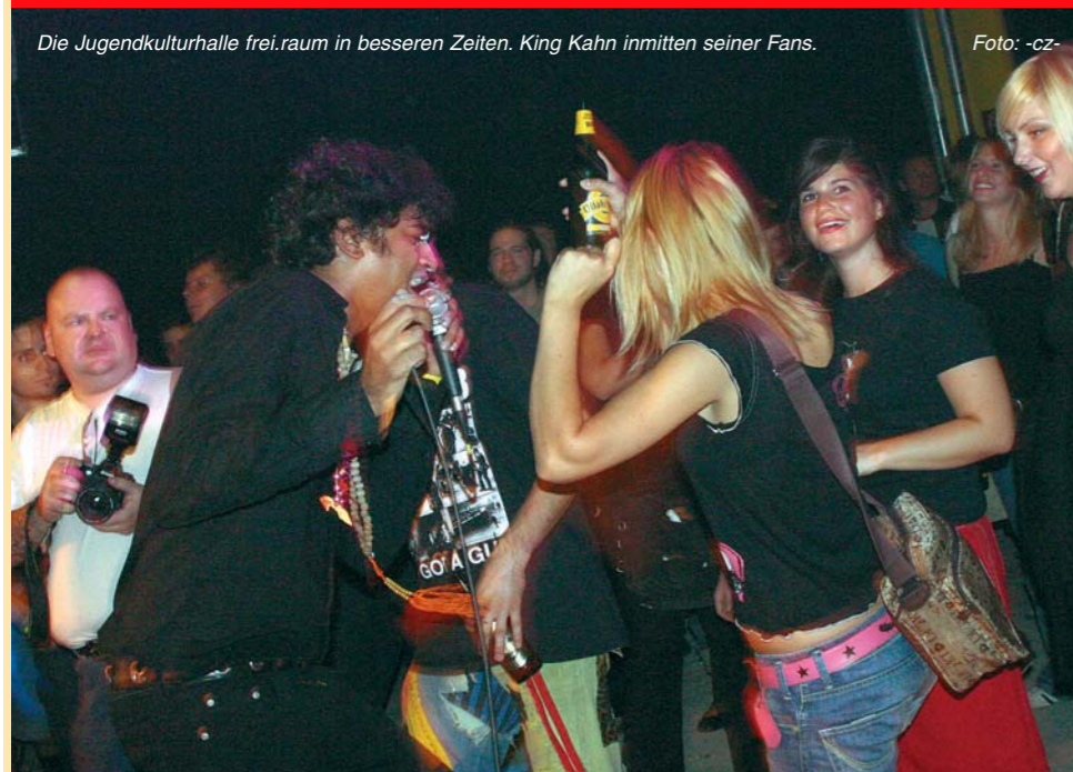
Die Jugendkulturhalle frei.raum in besseren Zeiten. King Kahn inmitten seiner Fans.