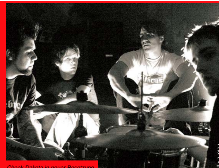
Cheek Dakota in neuer Besetzung

Cheek Dakota Version 2 Punkt 0. Nach fast zweijähriger Funkstille kehren die St. Pöltner Rocker runderneuert in Bandgefüge und Sound auf die Bretter der heimischen Bühnen zurück. Und auch einen ersten CD-Output will der Vierer noch im Laufe dieses Jahres auf die Welt bringen.