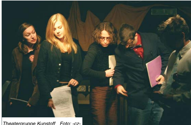
Theatergruppe Kunststoff