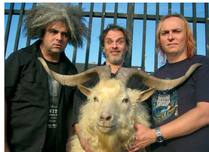
Die Melvins kommen zur Mike Patton Night auf das Donaufestival 06