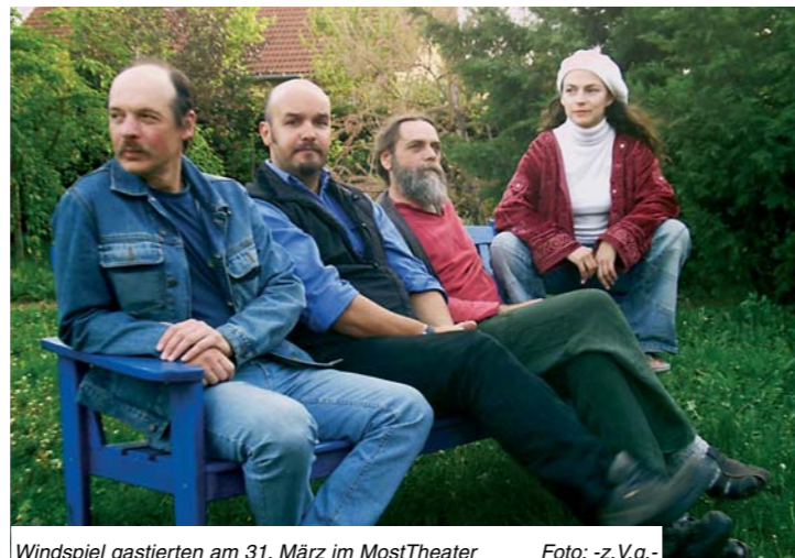
Windspiel gastierten am 31. März im MostTheater

Kabarets, Theateraufführungen, Diskussionsrunden, Buch- und Filmbesprechungen, Musikabende (von Folk bis Pop) und Nachwuchspräsentationen finden auch in regelmäßigen Abständen Plaudereien mit Prominenten statt. Das „MostTheater“ fasst ca. 120 Personen und seit der Gründung konnten schon um die 3000 Besucher begrüßt werden. Der nächste Termin ist am 5. Mai das Konzert der Gasslspieler (mittelalterliche Tanzmusik). Nähere Infos unter www.mosttheater.com