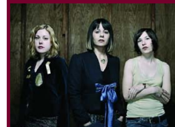
Sleater Kinney John Clark, z.Vg.

Am ersten Wochenende (21.-24.4.) bilden Ängste und deren utopische Auflösung Pfeiler des Programms. Mit dabei sind Chicks On Speed, Liars, Xiu Xiu, Prefuse 73, Alec Empire, Sleater Kinney, Jim Thirlwell aka Foetus und die Theatergruppe Nico and the Navigators. Das Auftauchen aus gesellschaftlicher Anonymität und das Formulieren von politischen