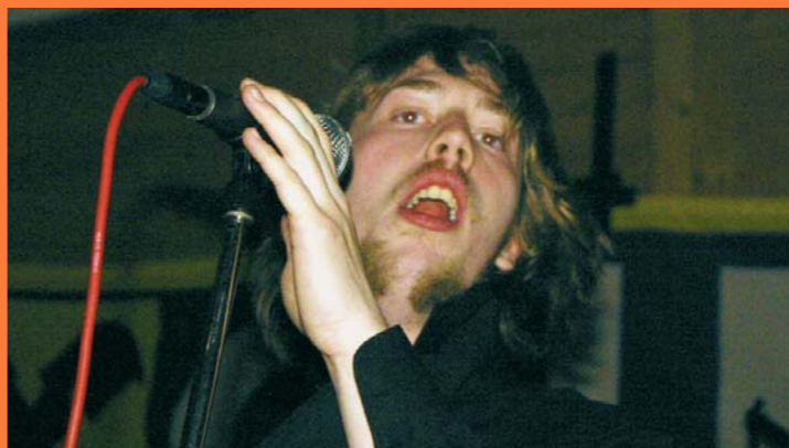
Als eine von vielen Bands wollen S.H.E. für die Tsunami-Opfer rocken