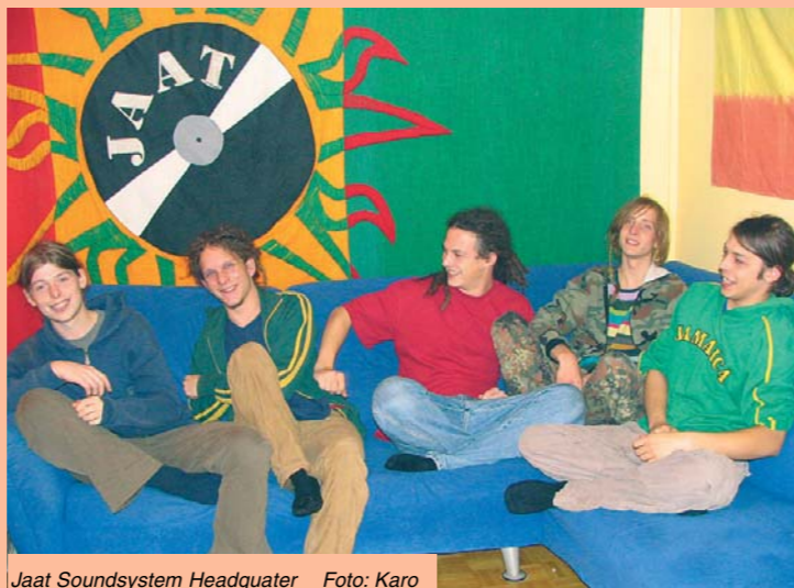
Jaat Soundsystem Headquarter

„Stand Strong 2003“ sowie diversen Veranstaltungen im Mostviertel (u.a. „Boarder Party“ in Mank/Kilb) seine Fähigkeiten unter Beweis stellen. Aber auch als Veranstalter konnten sie punkten, wie das erfolgreiche „Jimanu 2004“ (u.a. mit Mono & Nikitaman) gezeigt hat. Das Jaat Soundsystem stellt eine willkommene Bereicherung für die pulsierende Ragga-Szene in St. Pölten dar. Für mehr Info's zu Jaat und Auftritten in ihrem Dunstkreis check out www.jaat.tk -Dr.J.-